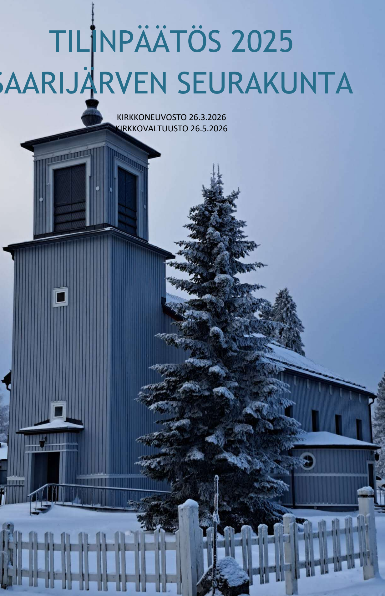
Pylkönmäen kirkko maalattiin kesällä 2025

KIRKKONEUVOSTO 26.3.2026 KIRKKOVALTUUSTO 26.5.2026