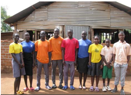
Kouluprojektin lapsia ja nuoria

Vähän väliä tietä pitkin marssivat valmistujaiskulkueet keskeyttävät arkiset toimet: lapset ja nuoret ovat pukeutuneet valmistujaisviittaan ja hattuun, kulkueita säestää torvien ja rumpujen soitto sekä iloinen huuto ja kiljunta. Tunnelma on varmaan monella tapaa samanlainen kuin ensimmäisen adventin evankeliumitekstissä, jossa Jeesus ratsastaa Jerusalemiin aasilla ja ihmiset huutavat hoosiannaa. Ilmassa on iloa ja riemua, eikä huomisen huolet sillä hetkellä vaivaa.